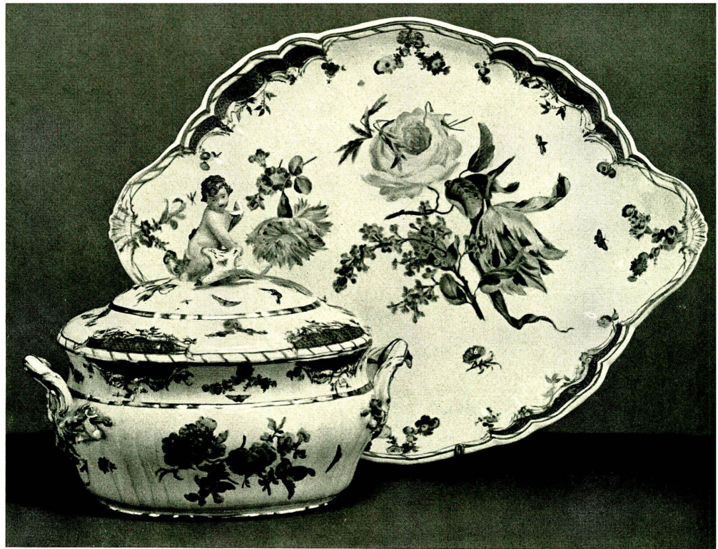
Ovale Terrine und Platte aus dem Service für das Breslauer Stadtschloß. Antikzierat mit farbiger Blumenmalerei und blauem Schuppen- mosaik 1767/68