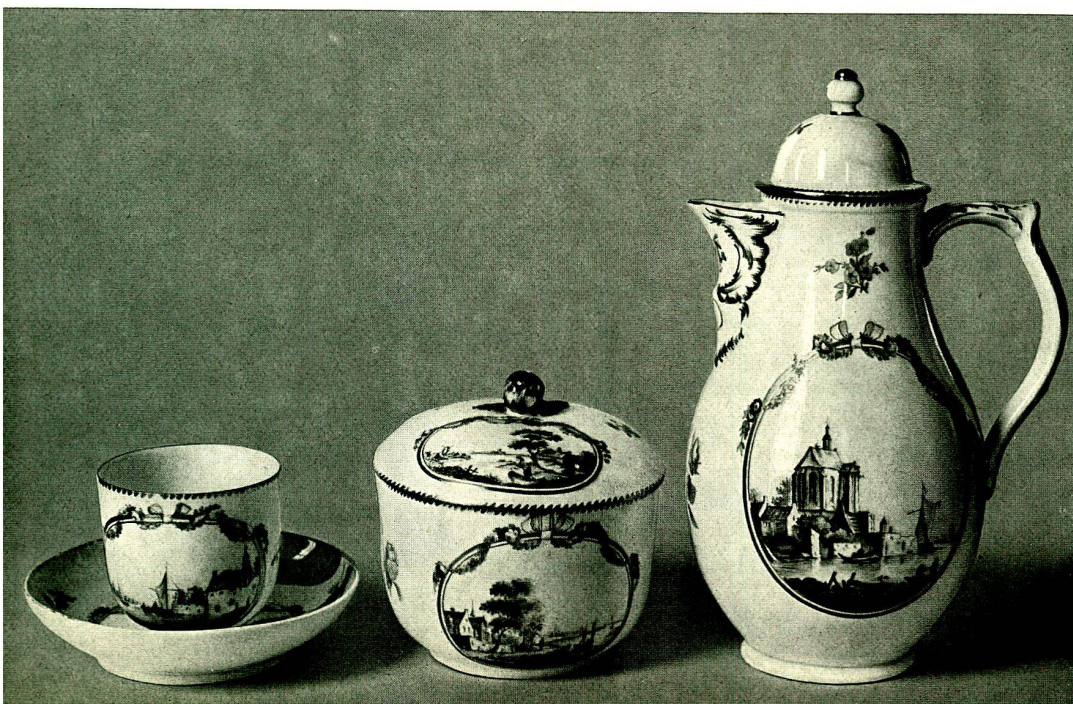
Tasse, Zuckerdose, Kaffeekanne, glatt mit Flußlandschaften Grisaille auf blaßgelbem Grund Goldene Umrahmungen mit farbigen Blumengirlanden und rosa Bandschleifen, um 1775

Der zweite Abschnitt enthält die Formgeschichte, die sich mit den schönsten deutschen Rokokoservicen, den Figuren der Brüder Friedrich Elias und Wilhelm Christian Meyer, mit den Plastiken Shadows, der Berliner Blumenmalerei, den prächtigen Dekorationen der Zeit des Wiener Kongresses befaßt, als auch die Schwierigkeiten der Periode des Historismus, die neue Blüte während des Jugendstils schildert und die durch die Industrialisierung unserer Zeit aufgetakommenen Fragen der Formgestaltung behandelt.