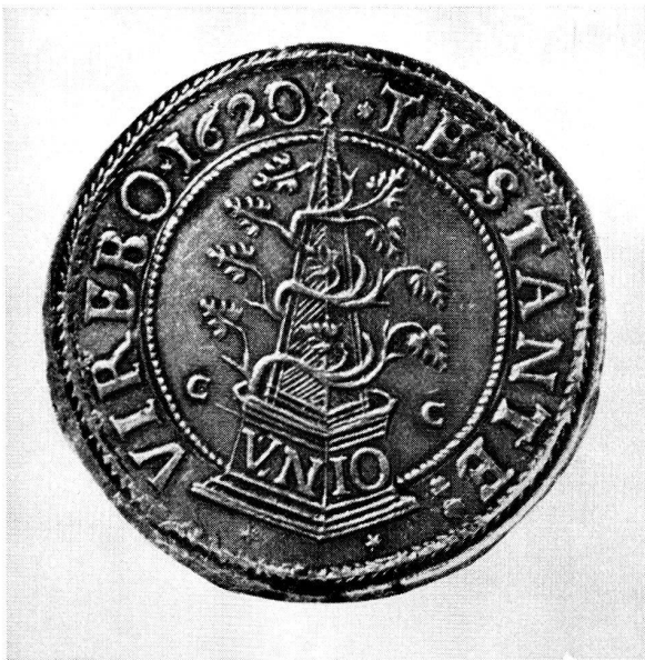
Abb. 2. Taler der aufständischen protestantischen mährischen Stände aus dem Jahre 1620 nach einer graphischen symbolischen Darstellung des Octavio de Strada, Hofantiquar Kaiser Rudolfs II.