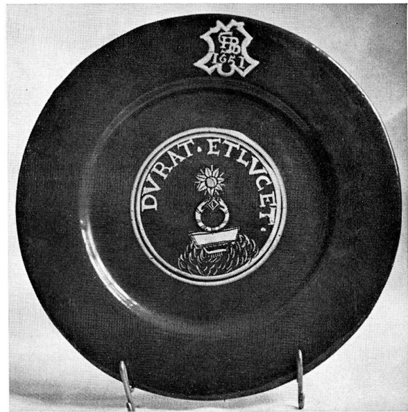
Abb. 3. Dunkelblau glasierter Fayenceteller mit Symbol und Devise, welche sich auf die Exilzeit der Freiherren v. Silberstein während des Dreissigjährigen Krieges beziehen. Die Bemalung nach Octavio de Strada. Wiedertäuferezeugnis, dat. 1651.