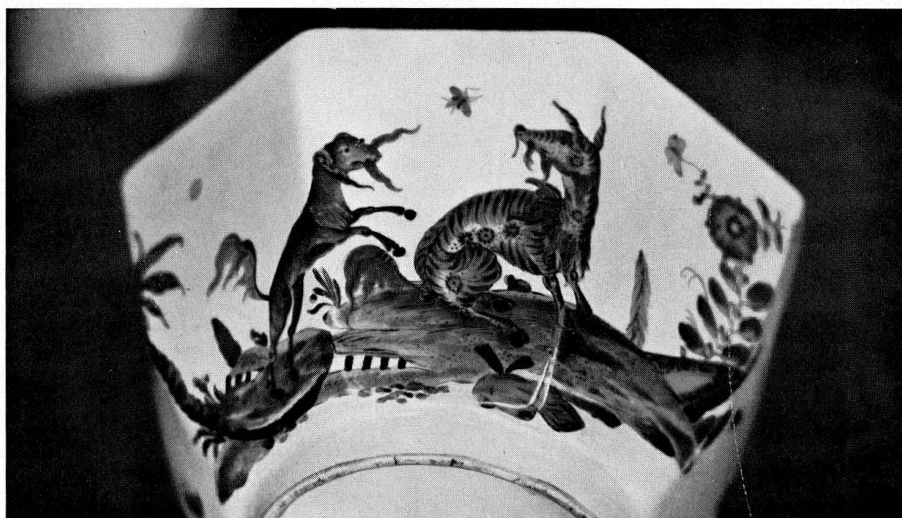
Abb. 24. Kumme, bunt bemalt mit Fabeltieren in Landschaft. Marke: Schwerter, Meissen um 1739.