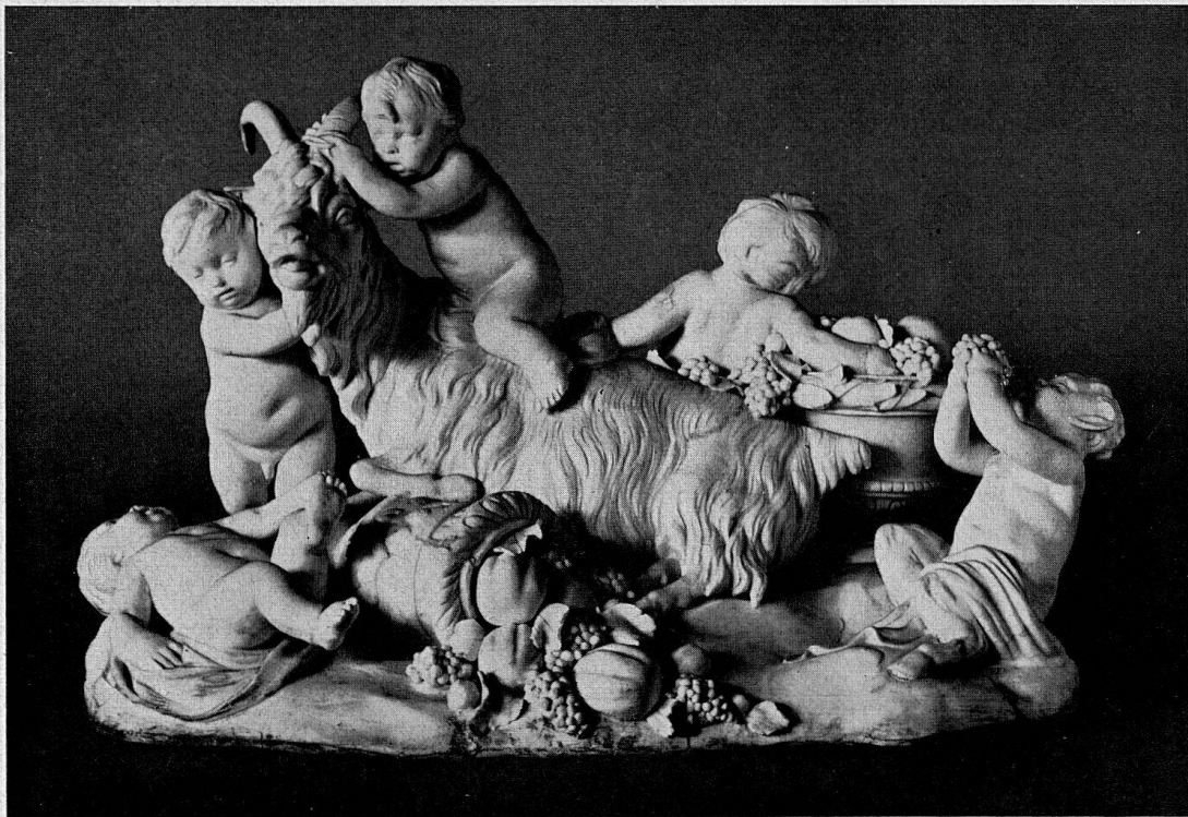
Putten und Faunkind, mit Ziegenbock spielend