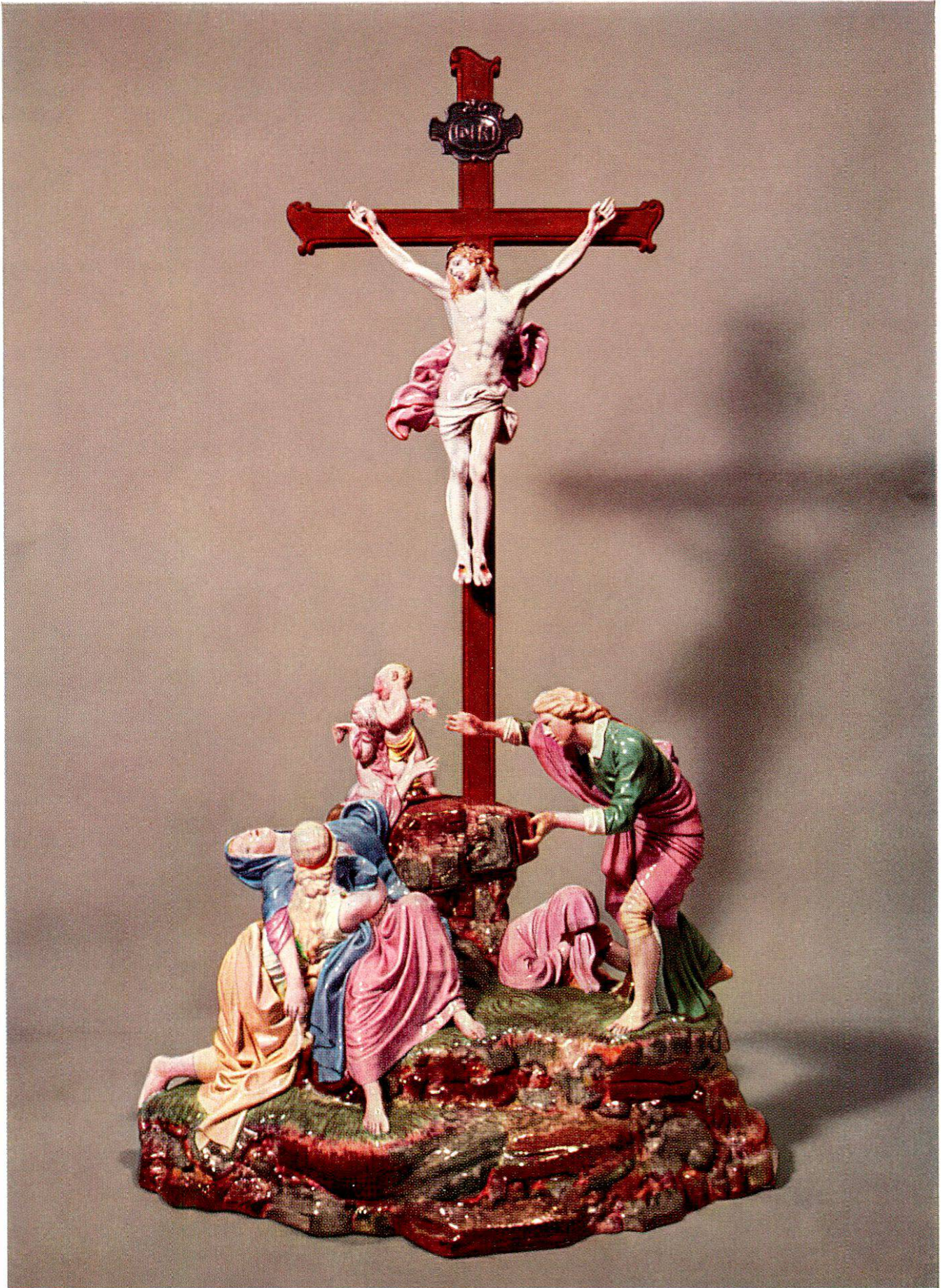
Johann Peter Melchior als Modellmeister in Höchst