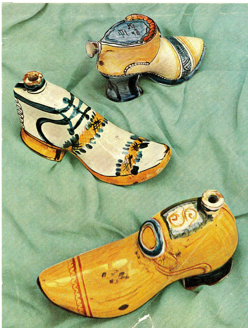
Sabots de Noël, Italien 17. und 18. Jahrhundert. Ballymuseum, Felsgarten, Schönenwerd

Bulletin de la société suisse des amis de la céramique