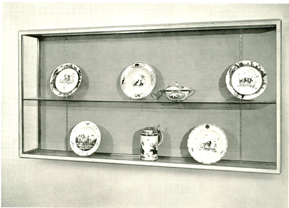
Eine Loewenfinck-Vitrine aus der Ausstellung im Kunsthaus Zürich, «Schönheit des 18. Jahrhunderts», Oktober 1955

Wir haben von der Ausstellung «Schönheit des 18. Jahrhunderts» 12 verschiedene Aufnahmen von Porzellanvitrinen herstellen lassen, zur Dokumentation des ausgestellten Kunstgutes und zur Erinnerung an unsere Jubiläumsausstellung. GröÙe der einzelnen Photos, wie die Abbildungen zeigen. Bestellung bitte an Sekretariat, Museggstraße 30, Luzern. Preis der ganzen Zwölferserie Fr. 25.-. Einzelne Karten können aus administrativen Gründen nicht abgegeben werden.