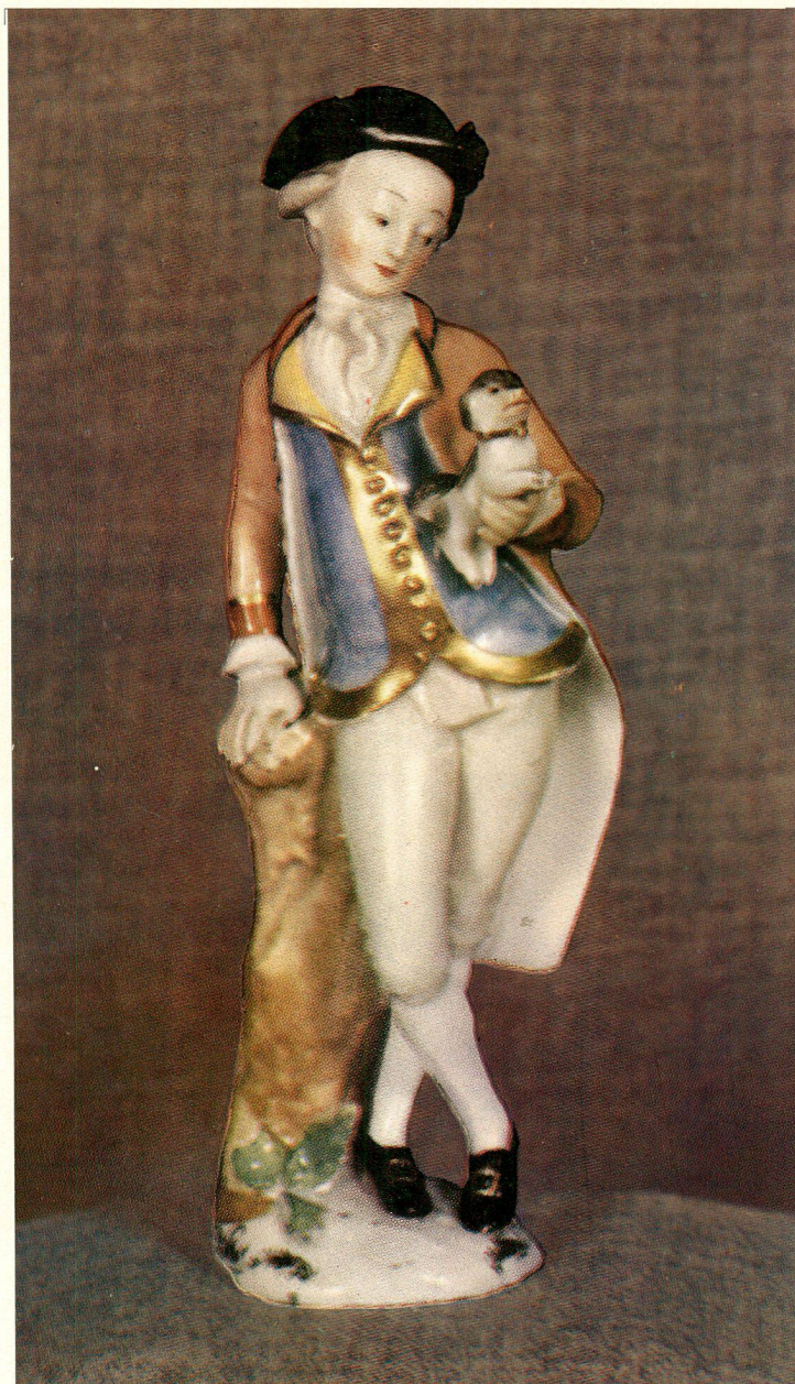
Wiener Porzellanfigur, Modell von Niedermeyer, um 1755

Bulletin de la Société des Amis de la Céramique Suisse