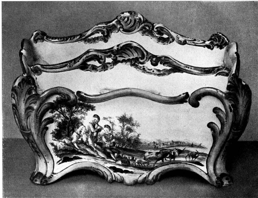
Abb. 2. Zu Chompert: Protais Pidoux. Jardinière-papeterie de forme rectangulaire à deux compartiments en étagère. Décor polychrome «Pidoux fecit le 26 8 b 1765 à Miliona»