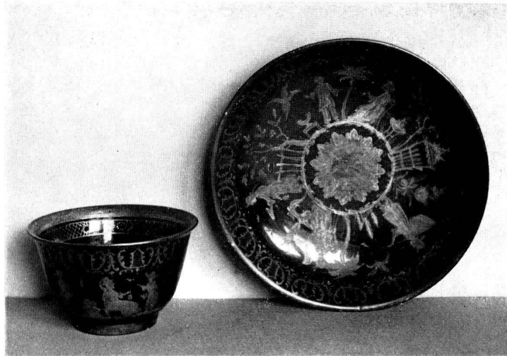
Abb. 4. Zu Ducret: Augsburger Hausmalerei. Tasse und Untertasse, schokoladenbrauner Fond mit radierten Silberchinesen. Augsburg 1757