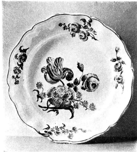
Abb. 3. Zu Chompret: Protais Pidoux. Assiette. Décor polychrome, aprey, Bouquets de fleurs, peints de Pidoux