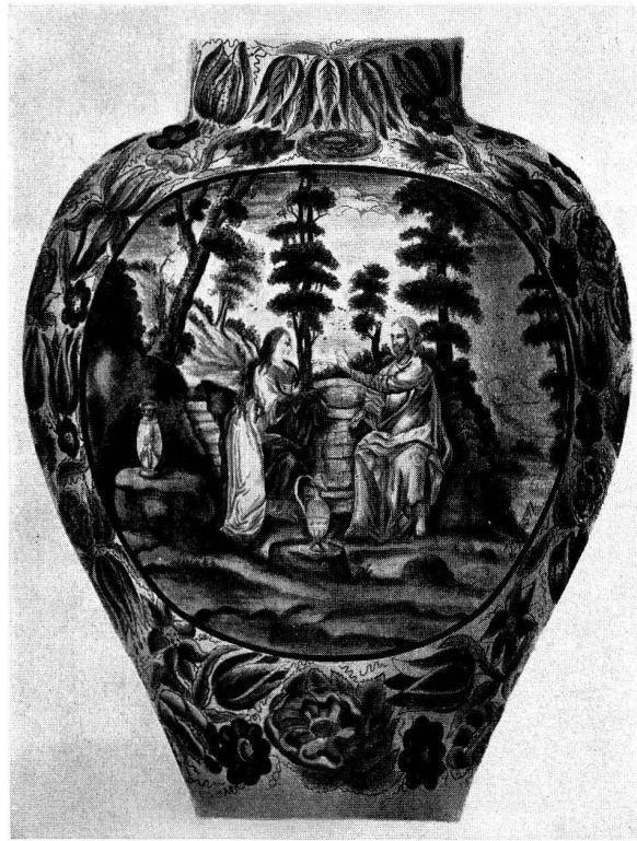
Abb. 1. Zu Braun: Nürnberger Hausmalerei