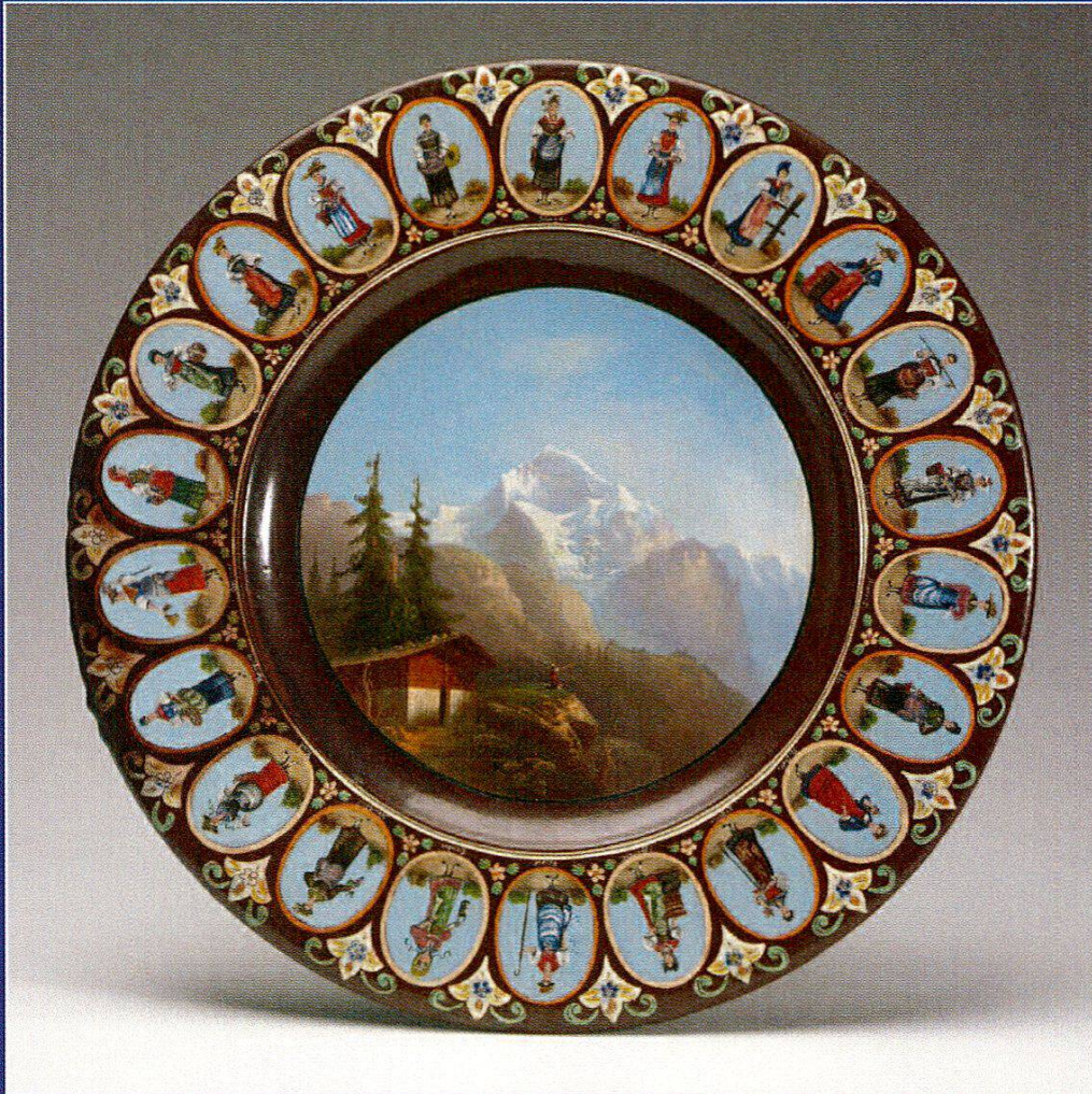
Bildteller, Thun um 1890