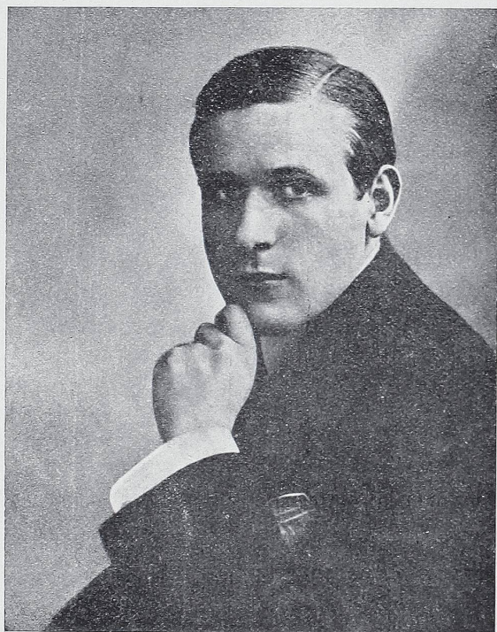
Regisseur Richard Eichberg