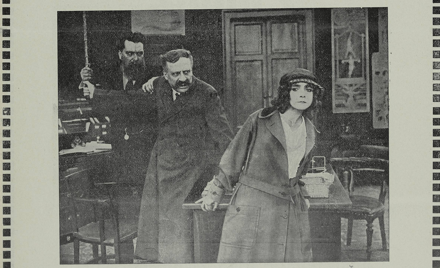
Verstossung der Tochter. 1005