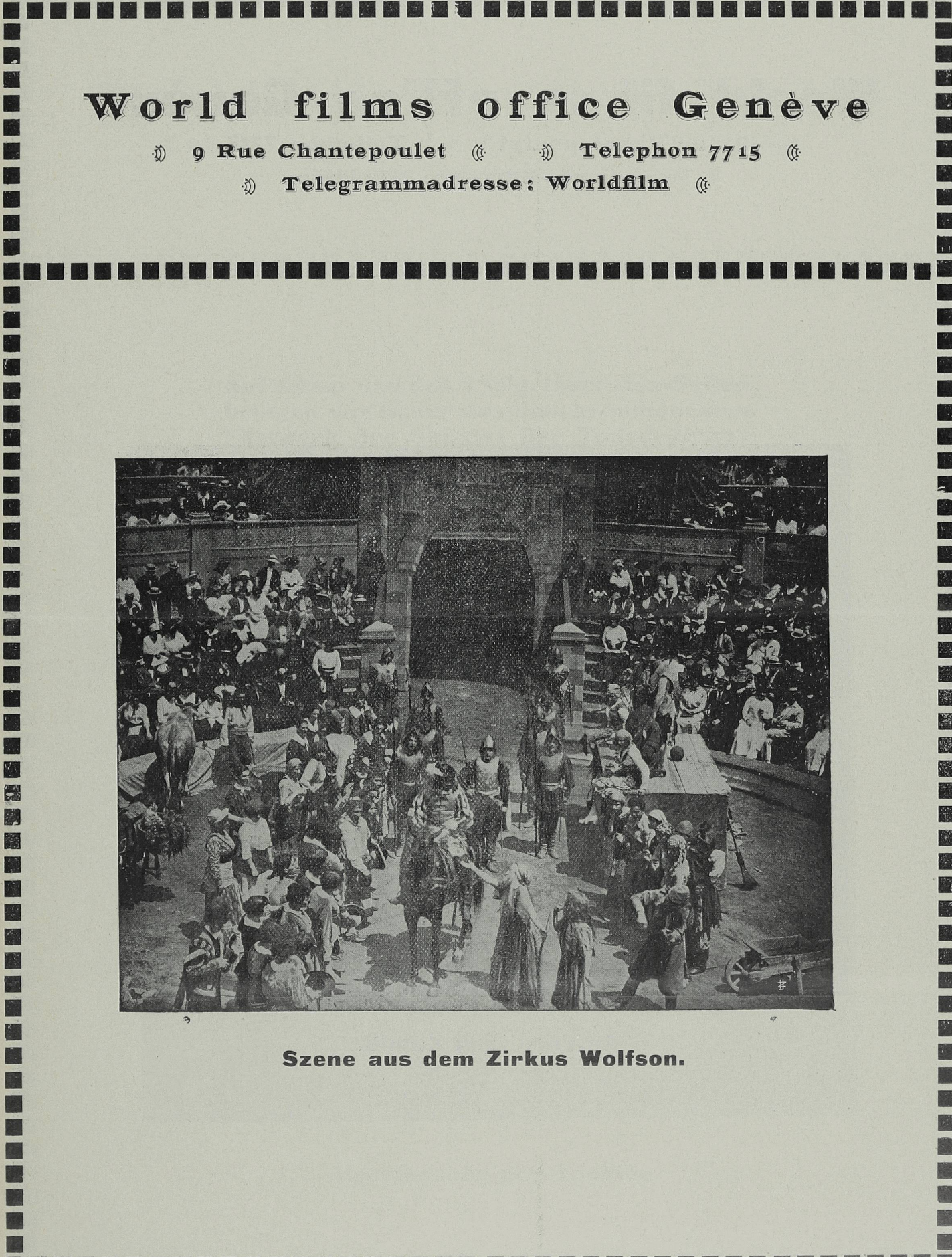
World films office Genève 9 Rue Chantepoulet ☎ ☎ Telephone 7715 ☎ ☎ Telegrammadresse: Worldfilm ☎ Szene aus dem Zirkus Wolfson.