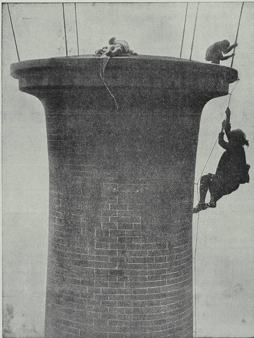
Rettung des verschleppten Kindes.