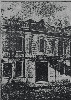
DIRECTEUR : E. LASNIER