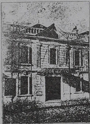
DIRECTEUR : E. LASNIER

SALLE de FÊTES avec SCÈNE et DÉCORS Pour Concerts, Représentations Théâtrales, Soirées de Sociétés, de Familles, etc. (CINQ CENTS PLACES)