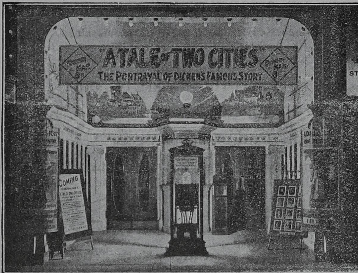
Eingang eines amerikanischen Kinos, wo der Gleichrichter zu Reklamezwecken verwendet wird.