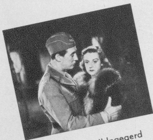
Szene aus: Fall Ingegerd