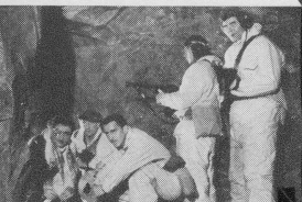
Szene aus: Lebe gefährlich