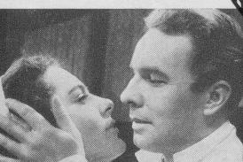
Szene aus: Die gelbe Klinik