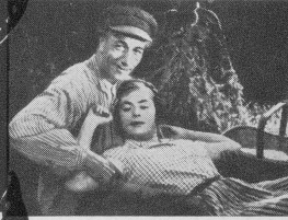
Szene aus: Die Frau der Brüder