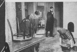
Szene aus: Elvira Madigan