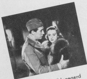
Szene aus: Fall Ingegerd