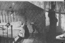
Szene aus: Heimkehr von Paris