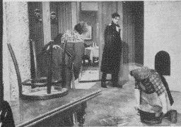
Szene aus: Elvira Madigan