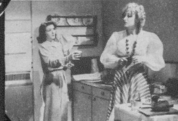
Szene aus: Anna Lans