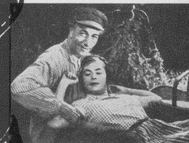
Szene aus: Die Frau der Brüder