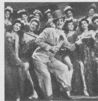
Szene aus: Zähl die heitern Stunden nur