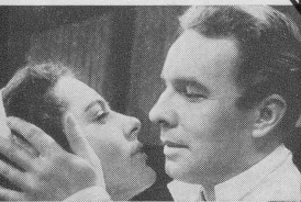
Szene aus: Die gelbe Klinik