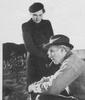
Szene aus: Eva und die Gemeinde