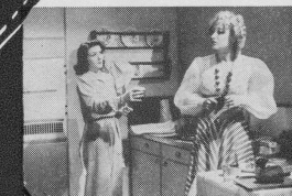
Szene aus: Anna Lans