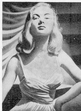
Veronika Lake in „Die Narbenhand“ Eos-Film AG., Basel