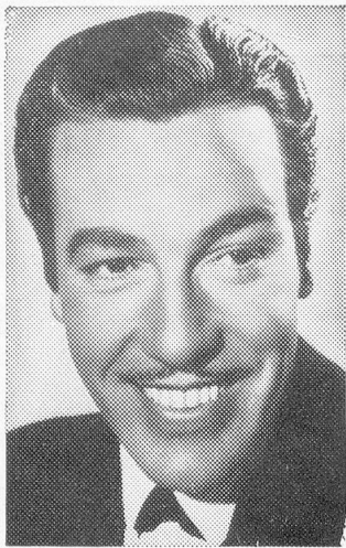
Cesar Romero in «Hello America» der 20th Century-Fox

schnürt und Tränen treibt, stelle ihn als wahrhaft großen Kriminalfilm von seltener Schönheit und als Zeitdokument hin. Damit hast du gar nicht so unrecht, denn es ist ein Dokument für den Geist in dir. Hebe hervor die Abenteuer von nie erreichter Spannung, die barbarisch und geheimnisvoll sind, sie wirken faszinierend, besonders der Todessprung aus gewaltigem, rauhem Hintergrund. Die Streiche und Zechgelage, bei denen der Bandit tüchtig in Wein, Weibern und Gesang als Desparado mit dynamischer Wucht aus der Unterwelt in unser sündiges Jahrzehnt frisch, frech und unbekümmert und in unsere von menschlichen Schwächen, Enttäuschungen erfüllte Welt tritt, wird brausendes Gelächter auslösen.