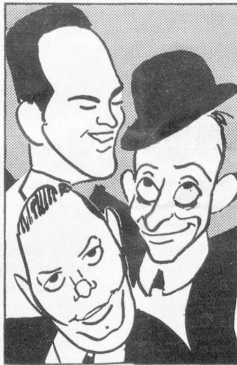
Das unwiderstehliche Trio der «Wiener Brothers» assistiert John Payne, Alice Faye und César Romero im Musik-Film-Schlager «Hallo Amerika!» der 20th Century-Fox.