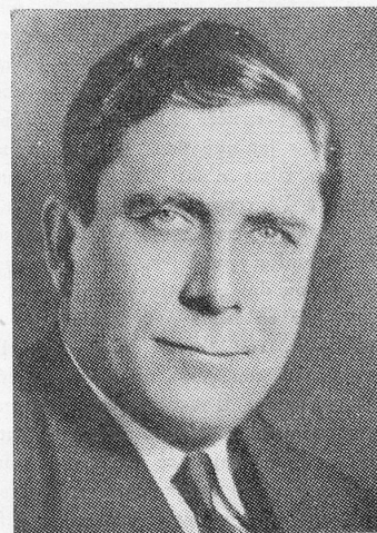
Wendell L. Willkie Président du Conseil des directeurs de la 20th Century-Fox

En raison du rationnement de l'électricité imposée aux usagers par le Secrétariat d'Etat à la Production Industrielle, et en vue de maintenir l'activité maxima compatible avec les mesures de réduction,