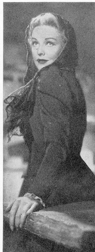
Madeleine Carroll ist die Partnerin von Gary Cooper in der Paramount-Technicolor-Production «Herzen in Flammen».

Und ohne alle Mühe können wir uns denken, daß die Schweizerfilme in Venedig nicht vom politischen, sondern vom rein kulturellen Standpunkt aus beurteilt werden. «Landammann Stauffacher» war für uns ein nationales Ereignis, war der Film unserer Nation, und jeder Schweizer nahm diesen Film mit einem Gefühl des tiefen Dankes an seine Hersteller hin. Sollen wir diese unsere nationalen Gefühle aber im Ausland zu Markte tragen, um vielleicht eine gnädige Anerkennung am Rande dafür zu ernten? Das Ausland wird auch so an unsere nationale Kraft glauben müssen, ob es den «Landammann Stauffacher» gesehen hat oder nicht. Wir hätten es lieber gesehen, wenn dieser kostbare Streifen innerhalb unserer Grenzen geblieben wäre. — So wir aber nach einem künstlerischen wertvolleren Film Umschau halten, wird uns die Tatsache enttäuschen, daß der Film «Romeo und Julia auf dem Dorfe» nicht nach Venedig geht. Keiner hätte es eher verdient, als dieses Produkt der Pro-Film A.-G. Und das Ausland hätte es uns wieder nicht verargt, wenn man zum zweitenmal Gottfried Keller'sche Verfilmungen hätte prämiieren müssen!»