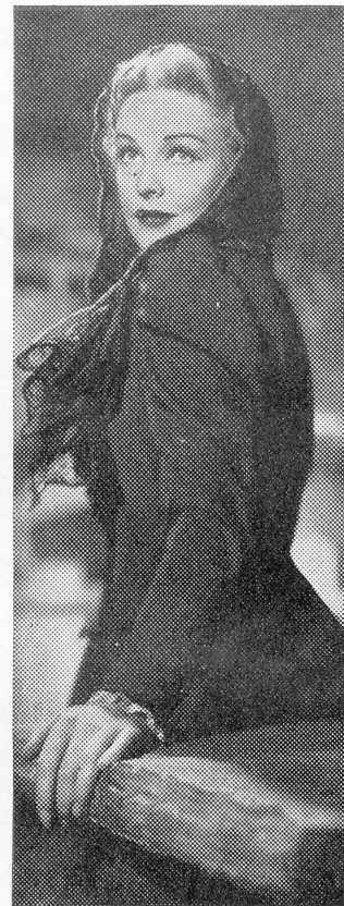
Madeleine Carroll ist die Partnerin von Gary Cooper in der Paramount-Technicolor-Production «Herzen in Flammen».

Und ohne alle Mühe können wir uns denken, daß die Schweizerfilme in Venedig nicht vom politischen, sondern vom rein kulturellen Standpunkt aus beurteilt werden. «Landammann Stauffacher» war für uns ein nationales Ereignis, war der Film unserer Nation, und jeder Schweizer nahm diesen Film mit einem Gefühl des tiefen Dankes an seine Hersteller hin. Sollen wir diese unsere nationalen Gefühle aber im Ausland zu Markte tragen, um vielleicht eine gnädige Anerkennung am Rande dafür zu ernten? Das Ausland wird auch so an unsere nationale Kraft glauben müssen, ob es den «Landammann Stauffacher» gesehen hat oder nicht. Wir hätten es lieber gesehen, wenn dieser kostbare Streifen innerhalb unserer Grenzen geblieben wäre. — So wir aber nach einem künstlerischen wertvolleren Film Umschau halten, wird uns die Tatsache enttäuschen, daß der Film «Romeo und Julia auf dem Dorfe» nicht nach Venedig geht. Keiner hätte es eher verdient, als dieses Produkt der Pro-Film A.-G. Und das Ausland hätte es uns wieder nicht verargt, wenn man zum zweitenmal Gottfried Keller'sche Verfilmungen hätte prämiieren müssen!»