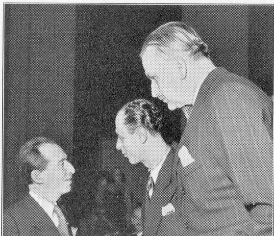
M. le Conseiller Fédéral Enrico Celió assiste en compagnie de M. le Conseiller National Henry Vallotton à la présentation au «Metropole» du film officiel de l'Exposition Nationale.