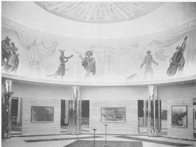
Le hall du METROPOLE est actuellement, de l'avis général, le plus beau de Suisse.

Inutile d'anticiper. Quand on connaît sa remarquable activité à Lausanne, l'on peut être certain que lorsqu'il aura à sa disposition encore une des meilleures salles genevoises, M. Fuchs va donner un immense essor aux spectacles dans ces deux villes. Et, nos meilleurs vœux l'accompagnent dans la laborieuse tâche qu'il entreprend avec un si grand entrain. J. Vr.