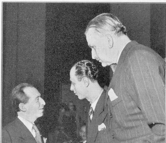
M. le Conseiller Fédéral Enrico Celio assiste en compagnie de M. le Conseiller National Henry Vallotton à la présentation au «Metropole» du film officiel de l'Exposition Nationale.