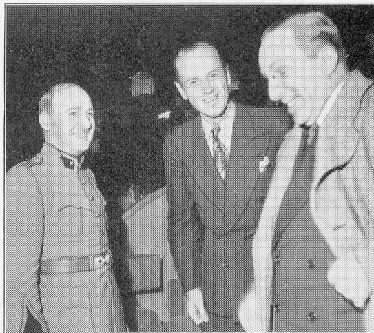
Un visiteur de marque, fidèle du «Métropole»: S. M. Alphonse XIII., l'ex-roi d'Espagne, qui échange d'aimables paroles avec M. le Conseiller National Pierre Rochat.