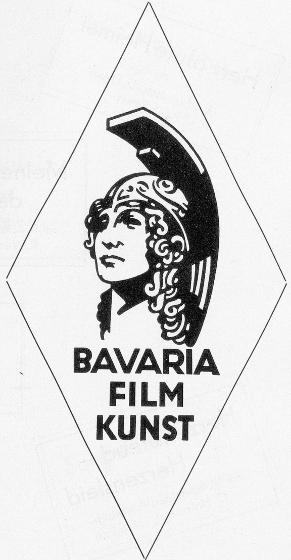
Bavaria Filmkunst G. m. b. H. München

NEUE INTERNA FILM A.-G. ZÜRICH Telephon 35797 Bahnhofquai 7