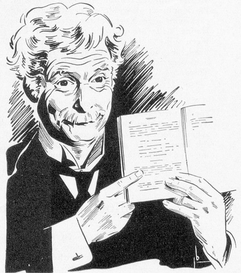
Robert Donat in «Leb wohl, Mr. Chips»

Alle diese so wundervoll beobachteten und von Sam Wood und den beiden unvergleichlichen Hauptdarstellern Robert Donat