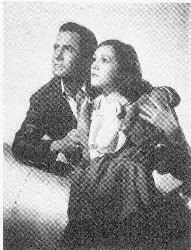
Nancy Kelly et Edward Norris dans «Descente en vrille» (Tail Spin). 20th Century-Fox.

triebe dürfen nur solche Bilder aus Filmaufnahmen vervielfältigen oder zur Veröffentlichung annehmen, die