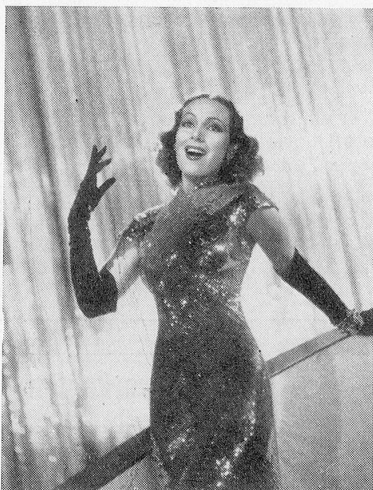
Shanghai, internationale Niederlassung. Nous reverrons la très belle Dolores del Rio dans «Concession internationale» (International settlement.) Film de la 20th Century-Fox.

Weitere Filme der Produktion 1940/41 befinden sich in Vorbereitung und werden demnächst in Angriff genommen, darunter Großfilme von sensationellem Ausmaß. Alle großen und beliebten Stars, Regisseure und Komponisten der letzten Jahre sind wieder bereit, den neuen Filmen die notwendige Zugkraft zu geben. Auch im neuen Geschäftsjahr werden wir mit einer Produktion aufwarten können, die Ihre Erwartungen in jeder Hinsicht erfüllt.