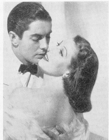
Meine Frau sucht einen Mann. Nous retrouvons le couple idéal. Loretta Young et Tyrone Power dans le beau film de la 20th Century-Fox «J'ai deux maris» . Second Honeymoon.)