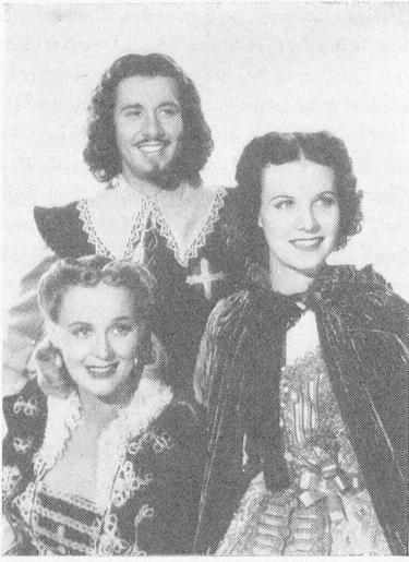
Don Ameche (D'Artagnan), Pauline Moore (Constance), Gloria Stuart (La Reine) dans «Les trois Loufs... Quetaires» (The Three Musketeers).

sene Land einen Vertreter entsendet; den Vorsitz führt der Präsident des Internationalen Katholischen Filmbüros. Das Ehrenkomitee umfaßt zahlreiche geistliche und weltliche Persönlichkeiten von Ruf. Ein technischer Ausschuß wird in zweiter Lesung endgültig über die von den nationalen Stellen vorgelegten Manuskripte entscheiden. Das Sekretariat befindet sich: 29, rue d'Artois, Paris 8 o .