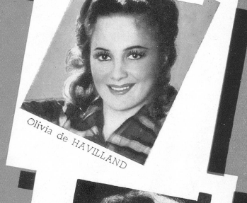
Olivia de HAVILLAND