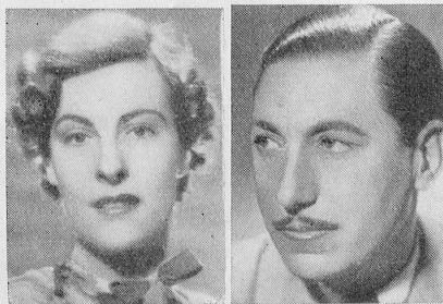
Marianne Hoppe und Willy Birgel, sowie René Deltgen, Hermann Speelmans, Max Gülstorff u. a. m. bescheren uns die Sensation des Ufa-Filmes von Ed. v. Borsody: «Kongo-Expres».