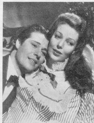
Loretta Young et Don Ameche dans « Et la parole fut ... » (The Story of Alexander Graham Bell).

« Charlie Chan in Reno » mit Sydney Toler und « Polizei-Inspektor Hurnleich » mit Gordon Harker; etc.