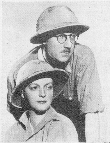
Armand Denis et Leila Roosevelt qui tournèrent le film magnifique « Magie africaine » (Dark Rapture) au Congo Belge.