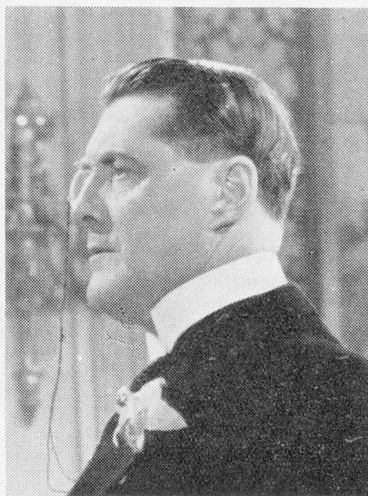
Sir Joë Chamberlain, Außenminister z. Z. Eduard VII. (aus Entente cordiale). Monopole-Pathé Films S. A., Genève

Die erste und wohl wichtigste ist, die Werbebilder im Text, in der Anordnung und in der Farbe so auszuführen, daß sie den Grundsätzen einer guten Werbung entsprechen. Wir beabsichtigen hier nicht über die zweckmäßige Ausgestaltung der Diapositive zu schreiben, sondern wollen nur kurz erwähnen, daß in dieser Beziehung die letzten Jahre eine außerordentliche Verbesserung des Werbemittels «Kino-Diapositiv» gebracht haben. Die zweite in ihrer Bedeutung nicht zu unterschätzende For-