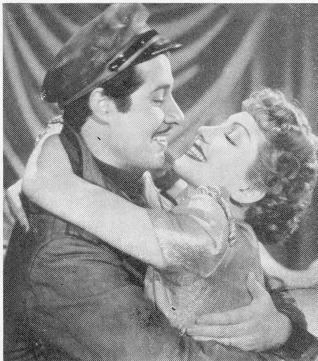
Claudette Colbert und Don Ameche in einer reizenden Szene aus dem Paramount-Großfilm «Mitternacht». Regie: Mitchell Leisen. Verleih: Eos-Film A.-G., Basel.

Es gibt zwei Wege, die Kinder vor unerwünschten Filmen zu schützen: den positiven Weg durch Herstellung eines genügenden Vorrats passender Filme und durch Erziehung des kindlichen Geschmacks, damit sie solchen Filmen vor anderen den Vorzug geben, und den negativen Weg, der Zensur und der Zulassungsbeschränkung. Theoretisch ist der positive Weg vorzuziehen, aber praktisch haben die meisten Länder es notwendig gefunden, die Jugend durch gesetzliche Verbote vor ungeeigneten Filmen zu schützen. — Der Bericht schließt mit der Feststellung, daß die Umfragen bereits zu fruchtbarer Diskussion und nützlichem Vorgehen in verschiedenen Ländern geführt haben. Doch dürfe der Film nie allein für sich betrachtet werden, sondern immer in Zusammenhang mit den anderen Freuden und Erholungen der Jugend, mit Spiel, Sport, Lagerleben, Kunst, Musik, die alle zusammenwirken, um ein volles und gesundes Freizeitleben zu schaffen.»