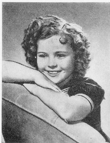
Shirley Temple spielt die Hauptrolle in « Heidi », einem neuen Film der 20th Century-Fox, der nach dem Roman von Johanna Spyri gedreht wurde.

Une chose demeure, cependant: le mode d'expression cinématographique que nous nous efforçons sans cesse d'améliorer. Si nous jetons un regard sur l'œuvre accomplie, nous pourrions nous convaincre de