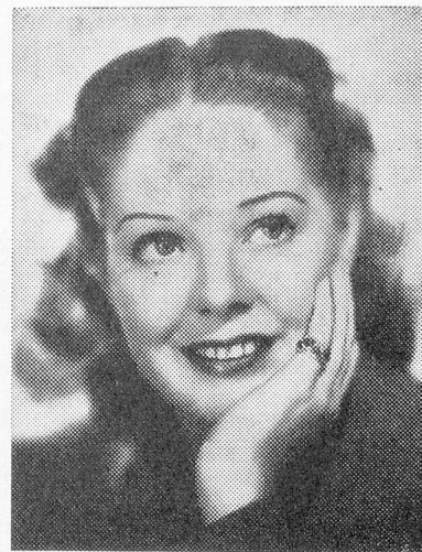
Alice Faye spielt im neuen 20th Century-Fox-Film « Chicago in Flammen ».

artistes nouveaux; « Tempête sur l'Asie », de Richard Oswald, avec Conrad Veidt, Sessue Hayakawa, Aimos et Mitchiko Tanaka; et « Raspoutine », d'après l'œuvre d'Alfred Neumann, réalisé par Marcel L'Herbier, avec Harry Baur, P.-R. Willm et Marcelle Chantal. Sont activement préparés « Jaurès », de Pierre Chenal, et « La Rue sans Joie », d'André Hugon, avec Dita Parlo, Albert Préjean, Marg. Derval, Line Noro et Inkyjioff.