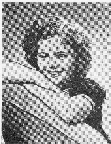
Shirley Temple spielt die Hauptrolle in « Heidi », einem neuen Film der 20th Century-Fox, der nach dem Roman von Johanna Spyri gedreht wurde.

Une chose demeure, cependant: le mode d'expression cinématographique que nous nous efforçons sans cesse d'améliorer. Si nous jetons un regard sur l'œuvre accomplie, nous pourrions nous convaincre de