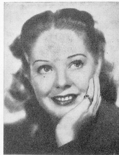
Alice Faye spielt im neuen 20th Century-Fox-Film « Chicago in Flammen ».