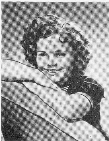
Shirley Temple spielt die Hauptrolle in « Heidi », einem neuen Film der 20th Century-Fox, der nach dem Roman von Johanna Spyri gedreht wurde.

Une chose demeure, cependant: le mode d'expression cinématographique que nous nous efforçons sans cesse d'améliorer. Si nous jetons un regard sur l'œuvre accomplie, nous pourrions nous convaincre de