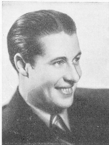
Don Ameche sehen wir im neuen 20th Century-Fox-Film « Chicago in Flammen ».

Parmi les films qu'on tourne à l'heure actuelle, il faut mentionner particulièrement « Les Gens du Voyage », de Jacques Feyder, avec Françoise Rosay et bien des