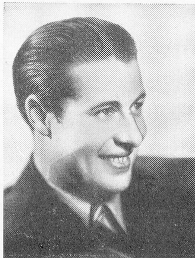
Don Ameche sehen wir im neuen 20th Century-Fox-Film « Chicago in Flammen ».

Parmi les films qu'on tourne à l'heure actuelle, il faut mentionner particulièrement « Les Gens du Voyage », de Jacques Feyder, avec Françoise Rosay et bien des