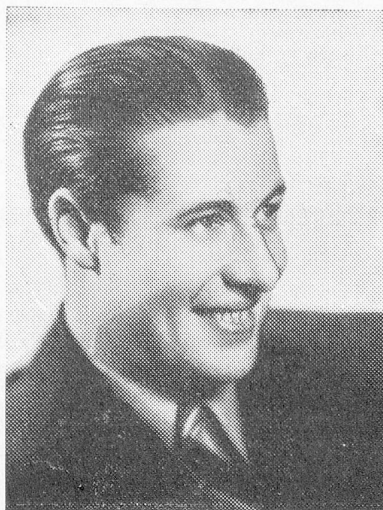
Don Ameche sehen wir im neuen 20th Century-Fox-Film « Chicago in Flammen ».

Parmi les films qu'on tourne à l'heure actuelle, il faut mentionner particulièrement « Les Gens du Voyage », de Jacques Feyder, avec Françoise Rosay et bien des