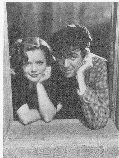
Simon Simon und James Stewart in «Im siebenten Himmel»; der wunderbare Film der 20th Century-Fox.

L'activité de Eos-Film reprend dans toute sa force.