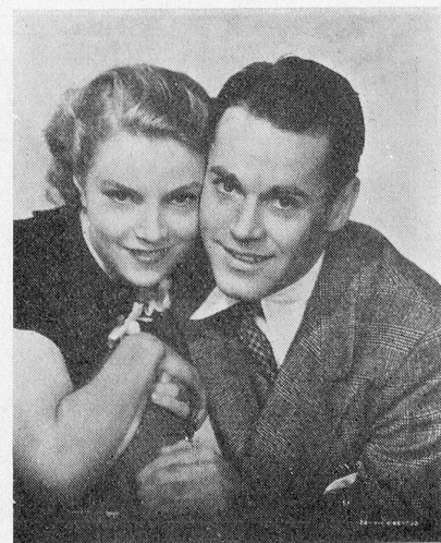
Annabella und Henry Fonda in «Das Schloss im Mond», Farbfilm der 20th Century-Fox.

Le programme de la Twentieth Century Fox est important, mais dans le nombre imposant des productions réalisées à Hollywood aux studios Fox, on a sélectionné trente-deux films destinés au marché suisse qui seront doublés. Il y aura parmi eux deux films d'Annabella qui furent tournés en Angleterre: «La Baie du Destin» et «Sous la Robe Rouge», ce dernier étant également joué par le grand acteur Conrad Veidt, et le premier étant fait en Technicolor. Simone Simon paraîtra dans «L'Heure Suprême», et dans «Sulz» qu'elle tournera à son retour de vacances. Enfin il y aura plusieurs «Charlie Chan» qui sont extrêmement populaires en suisse, «La Mascotte du Regiment», une adaptation de «Willie Winkle» de Rudyard Kipling avec Shirley Temple.