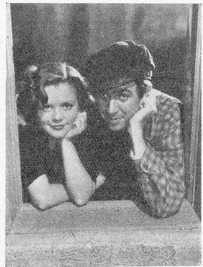
Simon Simon und James Stewart in «Im siebenten Himmel»; der wunderbare Film der 20th Century-Fox.

L'activité de Eos-Film reprend dans toute sa force.