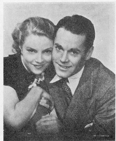
Annabella und Henry Fonda in «Das Schloss im Mond», Farbfilm der 20th Century-Fox.

Le programme de la Twentieth Century Fox est important, mais dans le nombre imposant des productions réalisées à Hollywood aux studios Fox, on a sélectionné trente-deux films destinés au marché suisse qui seront doublés. Il y aura parmi eux deux films d'Annabella qui furent tournés en Angleterre: «La Baie du Destin» et «Sous la Robe Rouge», ce dernier étant également joué par le grand acteur Conrad Veidt, et le premier étant fait en Technicolor. Simone Simon paraîtra dans «L'Heure Suprême», et dans «Sulz» qu'elle tournera à son retour de vacances. Enfin il y aura plusieurs «Charlie Chan» qui sont extrêmement populaires en Suisse, «La Mascotte du Regiment», une adaption de «Willie Winkle» de Rudyard Kipling avec Shirley Temple.