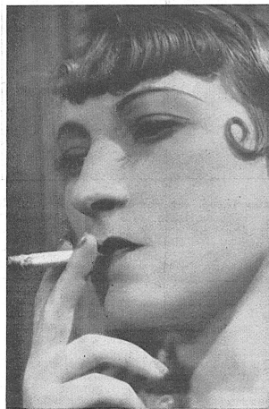
Orane Demazis, la célèbre Fanny, dans «Angèle». Un film de Marcel Pagnol. (D.F.G., Genève.)

Ct. de Berne. — Arrondissement de Porrentruy. Par ordonnance du 11 septembre 1934, le pré-