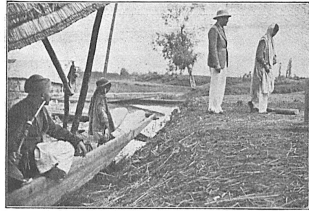
Gustav Diessl, der Hauptdarsteller des auf der Internationalen Himalaya-Expedition 1934 aufgenommenen Spielfilms, in einer Szene mit einem Hindu-Mädchen.

Vor allem muss man sich natürlich darüber klar sein, ob man von einer solchen Expedition einen reinen Reportage- (Kultur-) oder einen Spielfilm nach Hause bringen will. Selbst dabei schwanken viele Expeditionsleiter bis zum Schluss, und so wurde denn oft der Versuch gemacht, nach Rückkehr der Expedition einen Kul-