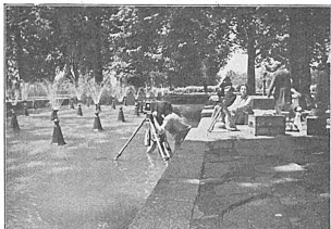
Angst und Friedel filmten unermüdetlich die Wasserteile in den Ghalimar-Gärten von Grinagar.

Die Rückreise von Bombay nach Europa wurde auf dem Dampfer «Conte Rosso» angetreten, der am 5. Oktober in Venedig eintrifft.