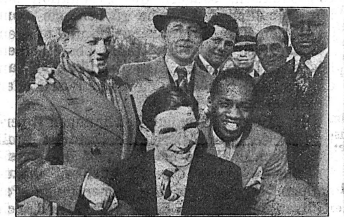
Boxeurs et... Joueur de films !