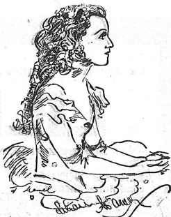
Lillian Harvey in dem Ufa-Film «Ich und die Kaiserin» («Moi et l'Impératrice».)