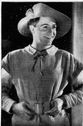
Willy Fritsch im Ufa-Grossfilm «Turandot».

Zur Zeit wird dort der neue Terra-Grossfilm nach Gottfried Keller's Novelle «Hermine und die 7 Aufrechten» gedreht. Besonderes Interesse zeigte der Herr Gesandte für die Aufnahmen der grossen «Festhalle», die aus Anlass des Aarau-Bundesschiessens im Atelier nachgebaut wurde.