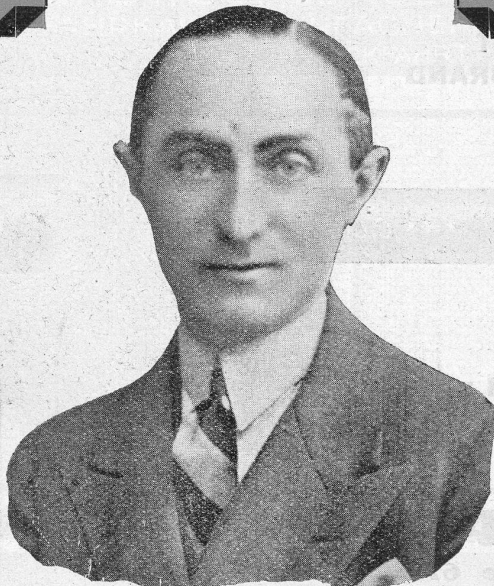
M. M. MARC

MIT DERSELBEN DIREKTION UNDER THE SAME DIRECTION