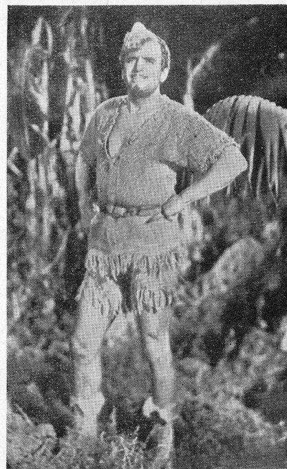
Douglas Fairbanks dans Robinson Moderne

— 26. Januar. Laut Statuten vom 25. Januar 1933 ist, mit Sitz in Glarus, unter der Firma Dux Film A. G. (Dux Film Ltd.) (Dux Film S. A.) eine Aktiengesellschaft von unbestimmter Dauer gegründet worden. Zweck der Gesellschaft ist die Beteiligung an Unternehmen aller Art, die Verwaltung von Beteiligungen, Erwerb, Verwaltung und Verwertung von Vermögenswerten aller Art, insbesondere Filmrechten, Liegenschaften usw., die Herstellung von Filmen, deren Verwertung und die Durchführung aller damit zusammenhängenden Geschäfte jeder Art, sei es im eigenen Namen und auf eigene Rechnung, oder für fremden Namen und Rechnung oder als Treuhänder. Die Gesellschaft ist berechtigt, Zweigniederlassungen im