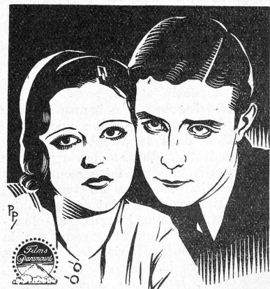
Henry Garat et Meg Lemonnier dans le grand succès Paramount La Rive Gauche

X. 27 !... un film où Sternberg s'est surpassé.