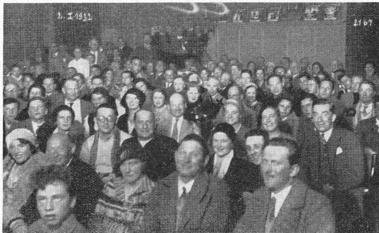
Charlie Chaplin und Sidney Chaplin im Apollo-Kino, in St. Moritz.

— « Weisser Rausch » in St. Moritz. — Im Apollo-Theater, St. Moritz , fand die Schweizer Premiere des Aafa-Sokal-Films