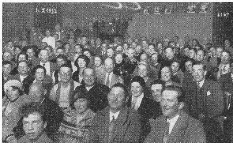
Charlie Chaplin und Sidney Chaplin im Apollo-Kino, in St. Moritz.

— Schweizer Produktion. — Wie wir erfahren, hat die frühere Film Aap. S. A. in ihrer ausserordentlichen Generalversammlung vom 4. Dezember 1931 ihren Namen in Cinegram Société Anonyme umgeändert. Die Firma ist in weiteren Kreisen bekannt geworden, weil sie seit ungefähr einem Jahr gemeinsam mit auswärtigen Firmen das Schweizer « Ciné-Journal », eine Tonfilmwochenschau, herausgibt, die jetzt in noch stärkerem Mass als bisher Originaltonfilmaufnahmen aus dem Bundesgebiet bringen. Sie verfügt jetzt über einen eigenen Tonaufnahmewagen, der nach dem Marconi-Patent arbeitet. Die bisherigen Arbeitsgebiete, nämlich die Aufnahmen von Industrie-, Werbe- und wirtschaftlichen Filmen, werden genau so fortgesetzt wie der Kopieranstaltsbetrieb.