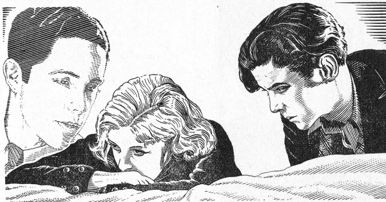
Hôtel des Etudiants.

— A la suite de la présentation d' Hôtel des Etudiants , Raymond Galle et Christian Casadesus ont été engagés pour cinq ans par la Société des Films Osso,