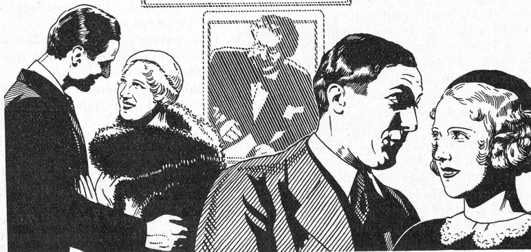
Une jeune fille et un million.

La très belle Betty Stockfeld, par son charme et son allure majestueuse, nous fait comprendre le nombre de soupirants qui l'entourent.