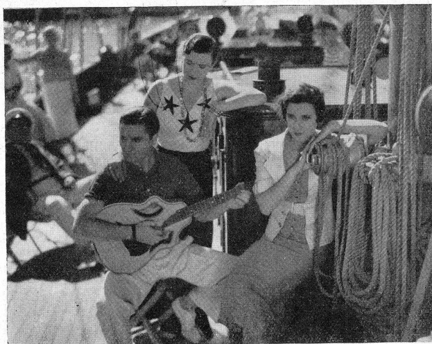
Jeanne Cheirel, Blanche Montel, Claude Dauphin dans Clair de Lune .