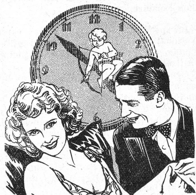
Une heure près de toi

Venus Blonde , avec Marlène Dietrich. Mise en scène de Josef Von Sternberg.