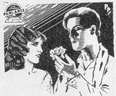
Dennis King & Jeanette MacDonald in einer Szene der ersten Sprechfilm-Oper der Paramount Der König der Vagabunden.

Signalons d'autre part que, poursuivant son programme d'extension, le Service de Distribution Haik va organiser très prochainement son agence Suisse.