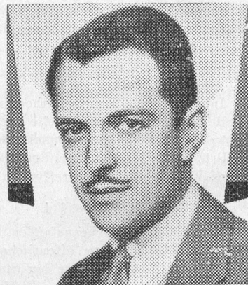
Kenneth MacKenna Fox Artist

Los Angeles Times . — En présence d'un tel film, on reste béant d'admiration, tant les paysages sont beaux, et l'on n'a plus l'impression d'être en face d'un écran, mais bien dans les contrées où se déroule l'action. La tornade est le spectacle le plus empoignant, c'est un véritable déluge qui s'abat sur les chars et les entraîne. Les roulements du tonnerre sont reproduits avec une étonnante vérité. Aucun film n'a encore