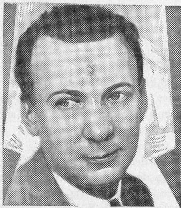
El Brendel Fox Artist

Comment se fait-il donc que Raoul Walsh, qui a pourtant au plus haut