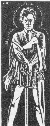
Dennis King dans son grand rôle dans le premier opéra filmé de la Pa- ramount Le Vaga- bond Roi.

degré le souci de vérité, ait modifié quelque peu l'ancien itinéraire ? C'est simplement parce que depuis cent ans la civilisation a pénétré dans ces contrées autrefois désertes, et que sur les bords du Missouri d'énormes usines, non seulement déchirent l'air de leurs coups sourds et de leurs bruits de sirènes que la camera Movietone, fidèle à sa tâche, eût enregistré. Après de longs préparatifs, ces conquérants modernes se mirent en marche. Ce n'est qu'après avoir parcouru nombre de kilomètres, que la camera put commencer son travail au signal que donnèrent les fouets claquant au-dessus des attelages de chevaux et de bœufs traînant les chars. Ces pionniers du film parcoururent ainsi sept Etats. Rien ne les rebutait ; par la grande chaleur comme par le froid le plus