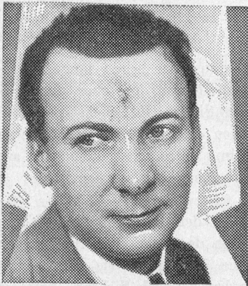
El Brendel Fox Artist

Comment se fait-il donc que Raoul Walsh, qui a pourtant au plus haut