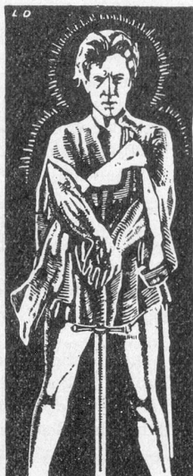
Dennis King dans son grand rôle dans le premier opéra filmé de la Pa- ramount Le Vaga- bond Roi.

degré le souci de vérité, ait modifié quelque peu l'ancien itinéraire ? C'est simplement parce que depuis cent ans la civilisation a pénétré dans ces contrées autrefois désertes, et que sur les bords du Missouri d'énormes usines, non seulement déchirent le paysage, mais encore déchirent l'air de leurs coups sourds et de leurs bruits de sirènes que la camera Movietone, fidèle à sa tâche, eût enregistré. Après de longs préparatifs, ces conquérants modernes se mirent en marche. Ce n'est qu'après avoir parcouru nombre de kilomètres, que la camera put commencer son travail au signal que donnèrent les fouets claquant au-dessus des attelages de chevaux et de bœufs traînant les chars. Ces pionniers du film parcoururent ainsi sept Etats. Rien ne les rebutait ; par la grande chaleur comme par le froid le plus