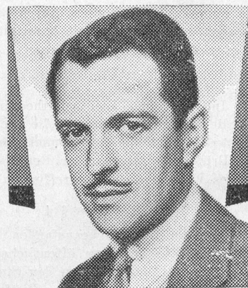
Kenneth MacKenna Fox Artist

Los Angeles Times . — En présence d'un tel film, on reste béant d'admiration, tant les paysages sont beaux, et l'on n'a plus l'impression d'être en face d'un écran, mais bien dans les contrées où se déroule l'action. La tornade est le spectacle le plus empoignant, c'est un véritable déluge qui s'abat sur les chars et les entraîne. Les roulements du tonnerre sont reproduits avec une étonnante vérité. Aucun film n'a encore