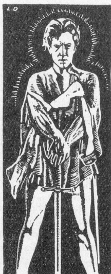
Dennis King dans son grand rôle dans le premier opéra filmé de la Pa- ramount Le Vaga- bond Roi.

degré le souci de vérité, ait modifié quelque peu l'ancien itinéraire ? C'est simplement parce que depuis cent ans la civilisation a pénétré dans ces contrées autrefois désertes, et que sur les bords du Missouri d'énormes usines, non seulement déchirent le paysage, mais encore déchirent l'air de leurs coups sourds et de leurs bruits de sirènes que la camera Movietone, fidèle à sa tâche, eût enregistré. Après de longs préparatifs, ces conquérants modernes se mirent en marche. Ce n'est qu'après avoir parcouru nombre de kilomètres, que la camera put commencer son travail au signal que donnèrent les fouets claquant au-dessus des attelages de chevaux et de bœufs traînant les chars. Ces pionniers du film parcoururent ainsi sept Etats. Rien ne les rebutait ; par la grande chaleur comme par le froid le plus