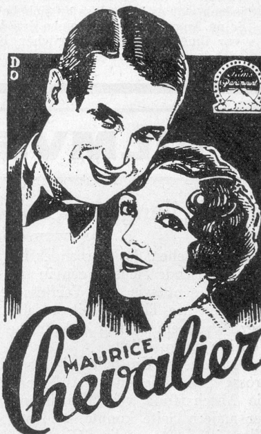
Maurice Chevalier avec sa partenaire Claudette Colbert dans son premier film parlant français La Grande Marée .