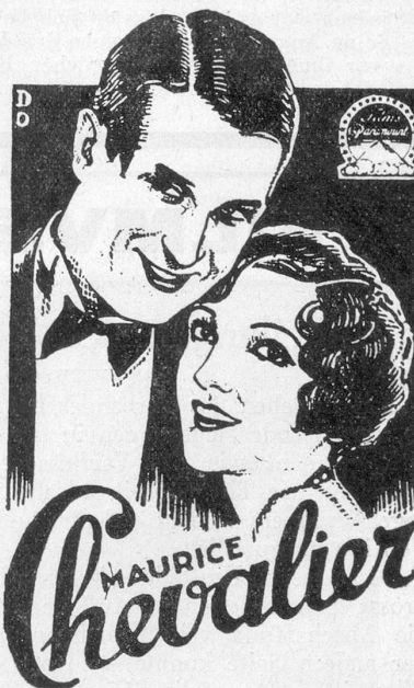
Maurice Chevalier avec sa partenaire Claudette Colbert dans son premier film parlant français La Grande Marne .