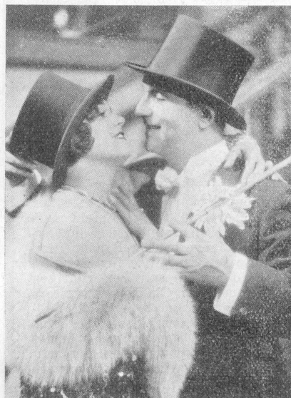
Michael Bohnen et Olga Tschechowa in Zwei Krawatten .